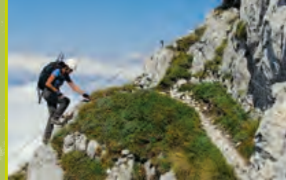
Krn - Silva Korena

Turizem Dolina Soče – TIC Kobarid Trg svobode 16, SI-5222 Kobarid t: 05 38 00 490 e: info.kobarid@dolina-soce.si www.dolina-soce.si www.dreznica.si