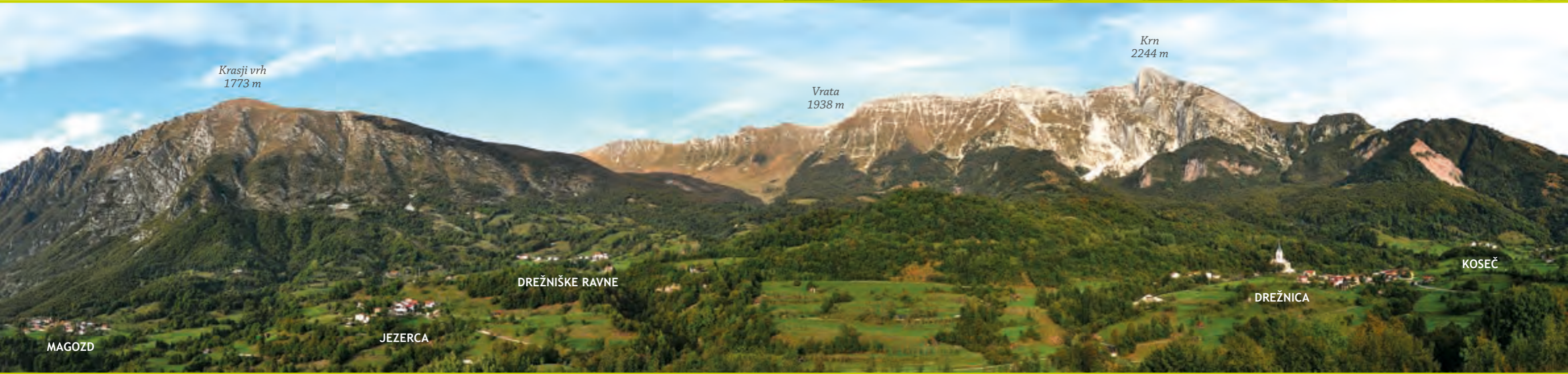
Krasji vrh 1773 m