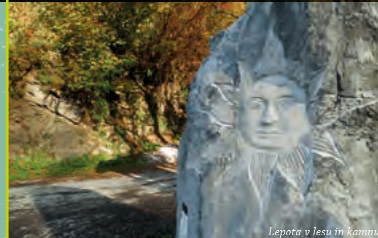
Lepota v lesu in kamnu

tukajšnjih prebivalcev še vedno pridno obdelujejo. Tu boste našli tako kotičke za sprostitev in oddih kot tudi obilo priložnosti za športne aktivnosti in rekreacijo. Območje je odlično izhodišče za pohodnike, gornike, jadrnalne padalce in kolesarje, na svoj račun pa bodo prišli tudi ljubitelji zgodovine in etnologije.