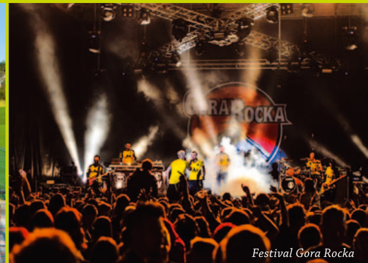
Festival Gora Rocka