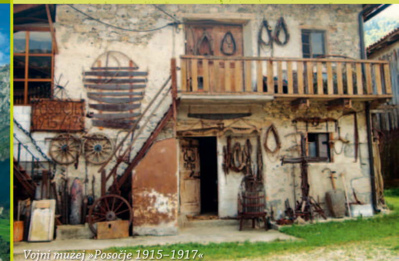
Vojni muzej »Posočje 1915-1917«

In tutti i secoli IDRSKO ha conosciuto il duro lavoro contadino. Ebbero successo soprattutto quelle fattorie, che avevano saputo trovare altre fonti di reddito oltre all'agricoltura e all'allevamento di bestiame. Queste dovevano essere famiglie numerose. Oltre al lavoro, gli abitanti avevano del tempo anche per la cultura e il divertimento. Attraverso la storia Idrsko apparteneva