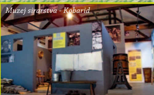
Muzej sirarstva - Kobarid

Zahvala za pomoč: Peter Stres, Boris Knapič, Kobariški muzej, Muzej sirarstva, Fundacija Poti miru, LTO Kobarid, Občina Kobarid, vaščanom Idrškega in Mlinskega.