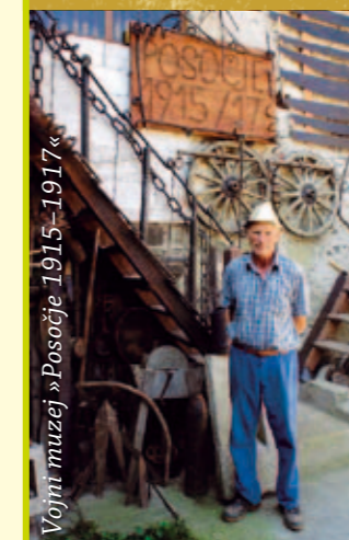
Vojni muzej »Posočje 1915-1917«