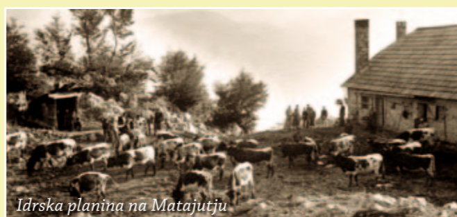
Idrska planina na Matajutju